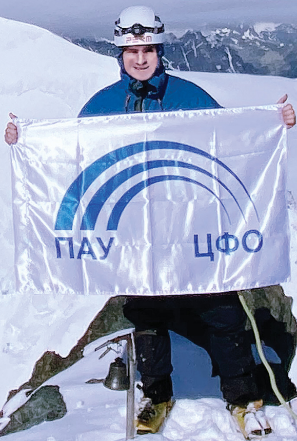
Флаг ПАУ ЦФО на вершине горы Белуха